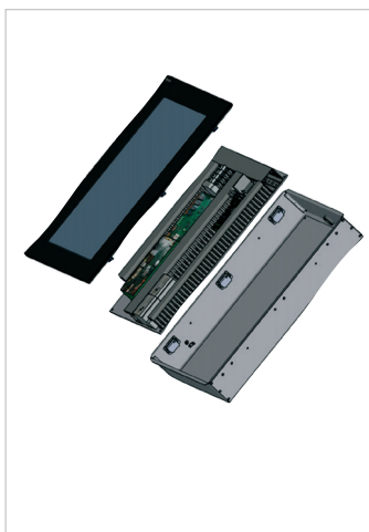
Einfache Montage (Plug & Play)